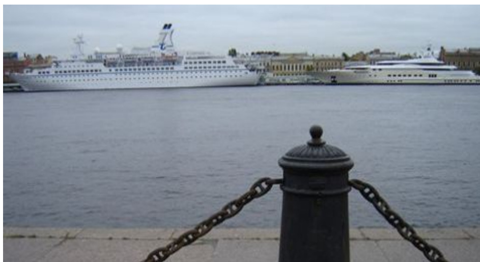
Санкт-Петербург. Фрагмент набережной Лейтенанта Шмидта.

только синтетическим. По сути, здесь рекламируют уже даже не пиво, а образ жизни, её смысл. Выгнали ум, выгнали правду, выгнали совесть, выгнали справедливость. А с чем остались? Да с тем, что на рекламе. И в этом вся идеология современной системы, если, конечно, не брать в расчёт то, что можно увидеть, взглянув чуть ниже.