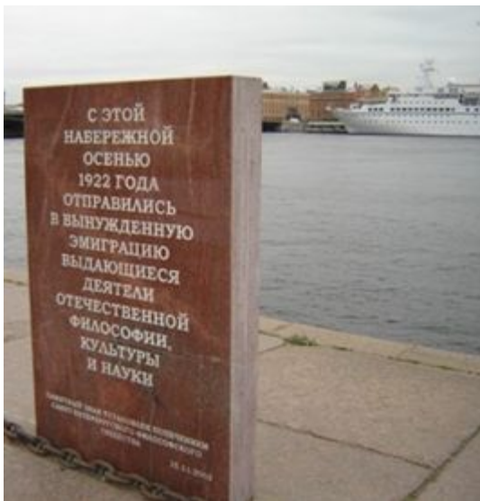
Санкт-Петербург. Фрагмент набережной Лейтенанта Шмидта. (Фото сделано Автором в 2008 году)

В проходящую постсоветскую эпоху, в душах огромного количества людей произошло нечто большее, чем полный и окончательный слом так и несбывшихся надежд. В это время повсюду произошло торжество тех, кто без колебаний продал свою честь и совесть. В это время, куда ни взгляни, везде торжествует ложь и повсюду попораны правда и справедливость. Вот, к примеру, ряд фотографий Санкт-Петербурга, сделанных в одно время и в одном месте в период расцвета эпохи «демократии». Взглянув на эти фотографии, на первый взгляд может показаться, что здесь вообще нет никого глубокого и интересного содержания достойного внимания. Действительно, эти места Санкт-Петербурга особо не привлекательны, они никогда не относились к открыточным и потому малоизвестны не то что гостям города, а даже некоторым его жителям. Но если посмотреть на всё более вдумчиво, то на самом деле всё будет несколько иначе, надо только внимательно посмотреть, чтобы понять, что же именно с нами произошло. Давайте внимательно посмотрим. Чуть ниже показано не что иное, как наслоение эпох, с ярко выраженными противоречиями, и, взглянув на всё это, можно будет более отчётливо и выразительно увидеть всю суть современных дней.