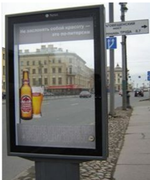
Санкт-Петербург. Фрагмент набережной Лейтенанта Шмидта.

заклучалась в том, чтобы уехать отсюда без особых проволочек, иначе бы причину, по которой они бы подлежали физической ликвидации, большевики могли бы найти быстрее, чем они успели бы собрать свои чемоданы. На «философских пароходах» принудительно было выслано около двухсот человек, а добровольно, как уже всем давно известно, из большевистской России уехало несколько миллионов. В то время начиналось строительство коммунистического мира. Новому советскому человеку предстояло войти в бесклассовое общество, в котором уже не должно было быть богатых, а, как выяснилось впоследствии, и умных тоже. Такие люди подлежали полному истреблению. Всем строителям коммунизма предстояло стать свободными, обеспеченными, наполненными огромным смыслом своего земного существования. А что в итоге? Что мы имеем сегодня? А для этого стоит посмотреть на следующее фото.