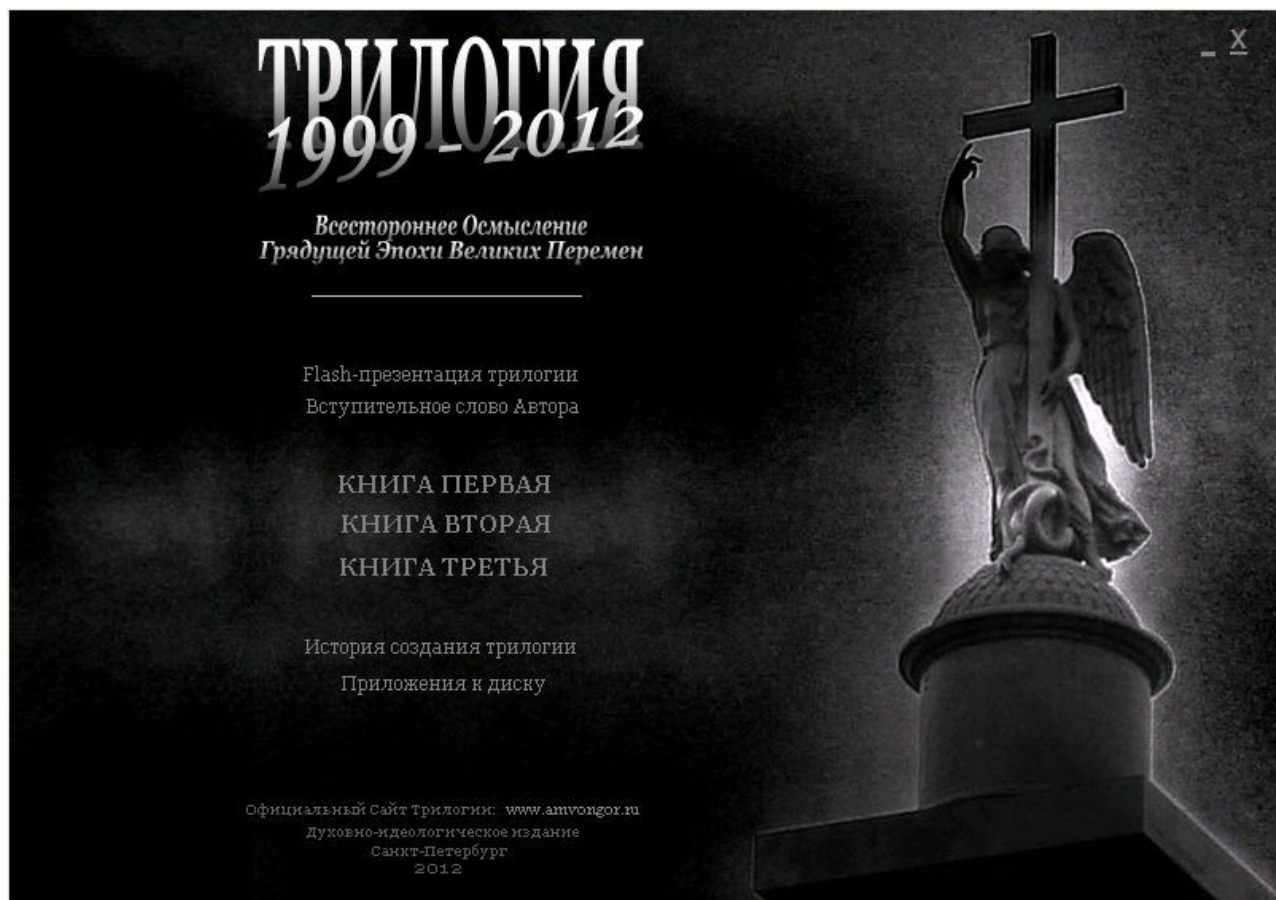
Главная страница электронной формы Трилогии «1999 -2012»

Всё содержимое упаковано в одном файле, который может свободно распространяться как во всемирной Сети, так и офлайн на любых электронных носителях (флешка, CD, DVD, HDD). Сам файл, при его раскрытии, имеет художественную форму, где всё представлено уже в целостном и полностью завершённом виде.